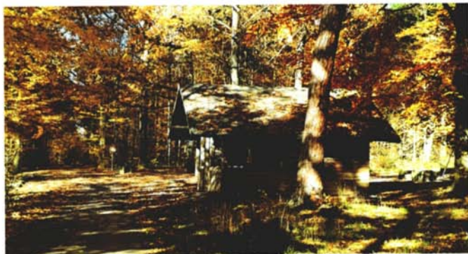
Hütte am Jünglingsplatz

Der Freundeskreis Asyl in Ispringen führt u.a. wöchentlich in einem Raum des Rathauses Deutschunterricht für Flüchtlinge durch. In drei Lerngruppen nehmen regelmäßig etwa 20 Personen am Sprachunterricht teil. Da die jungen Leute sich über jede Abwechslung freuen und gerne gebraucht werden, hat man sich letzten Freitag zu einem praktischen Sondereinsatz getroffen. Mit aus der Nachbarschaft geliehenen Besen wurden in einer gemeinsamen Aktion die Grillhütten auf dem Jünglingsplatz gefegt und gesäubert.